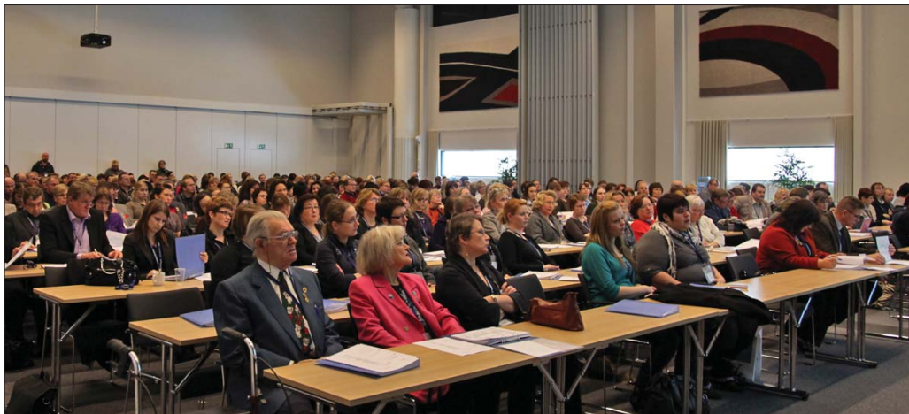
Vuoden 2011 KoiraExpossa osallistui lähes 400 koiraharrastajaa.

– Myös jalostusyhteisöt kuten Suomen Kennelliitto, jotka kirjaavat eläimiä kantakirjaan tai muuhun jalostusrekisteriin, saavat oikeuden pyytää kirjaamisen hakijaa toimittamaan nähtäväksi hakijaa koskevan otteen eläintenpitokieltorekisteristä. Jalostusyhteisöt saavat myös salassapitosäännösten estämättä oikeuden ilmoittaa eläinsuojeluviranomaisille, jos kirjaamisen hakijan epäillä rikkovan eläintenpitokieltoa, ministeri Tuija Brax selvitti uutta rekisterikäytäntöä.